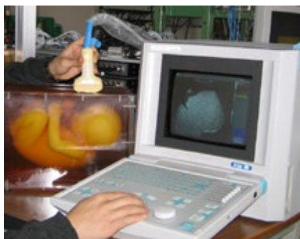
医療用超音波エコー