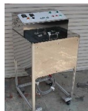
高性能なBDF 製造装置