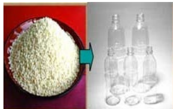
米からプラスチック